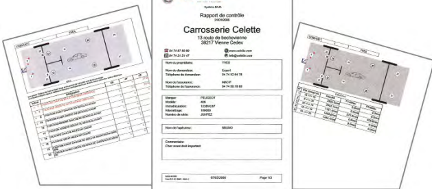
Ausdruck von Naja kontrollbericht / Reports control of Naja printed